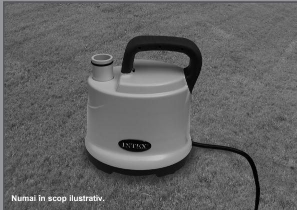
Numai în scop ilustrativ.

Nu uitați să încercați și aceste produse de calitate, marca Intex: piscine, accesorii pentru piscină, piscine gonflabile și jucării folosite în spații închise, saltele pneumatice și bărci, disponibile la distribuitori sau pe site-ul nostru.