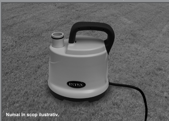
Numai în scop ilustrativ.

Nu uitați să încercați și aceste produse de calitate, marca Intex: piscine, accesorii pentru piscină, piscine gonflabile și jucării folosite în spații închise, saltele pneumatice și bărci, disponibile la distribuitori sau pe site-ul nostru.